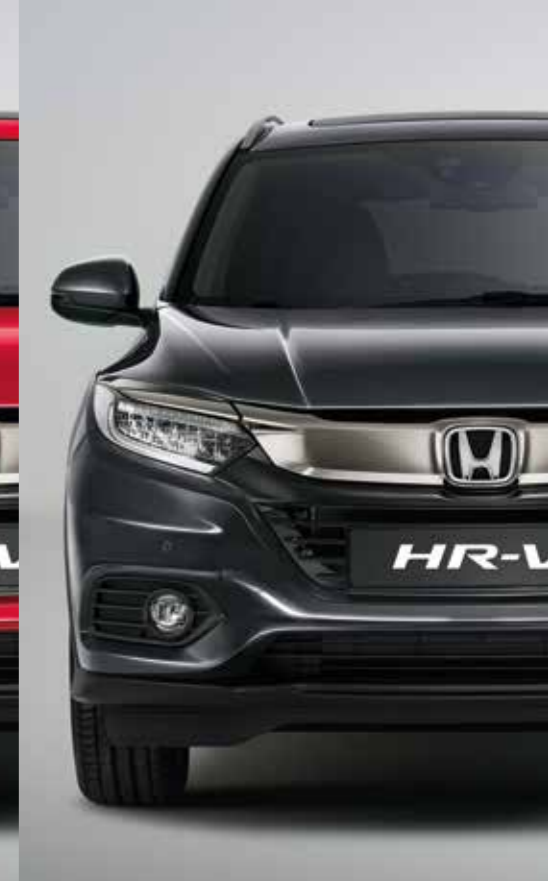
MODERN STEEL METALLIC