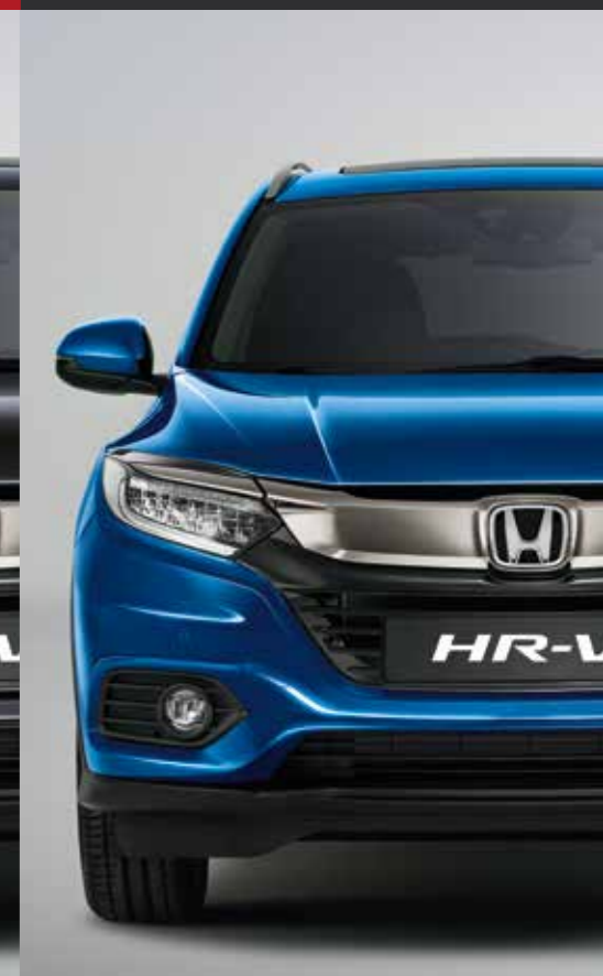
BRILLIANT SPORTY BLUE METALLIC