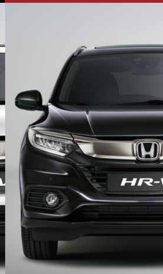
RUSE BLACK METALLIC