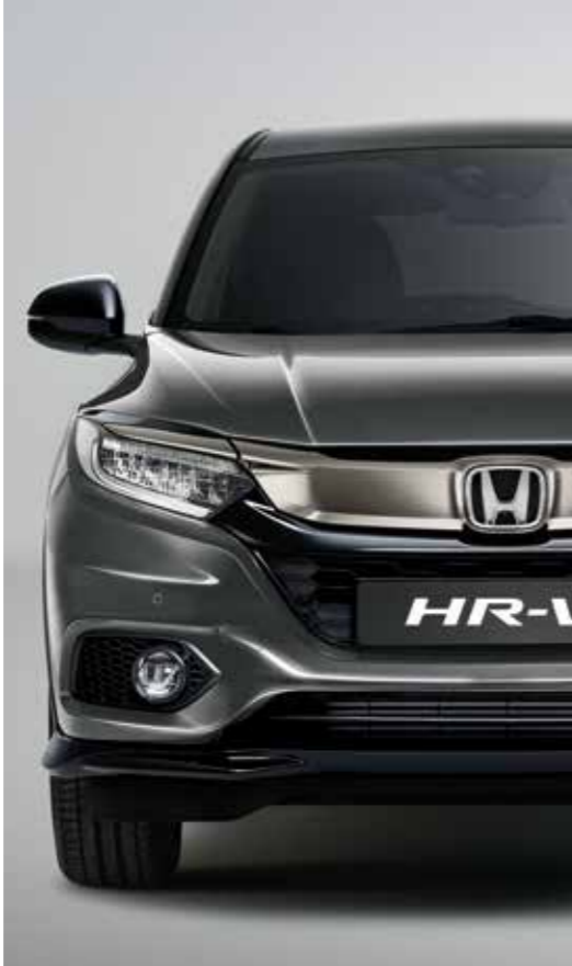
PLATINUM GREY METALLIC*