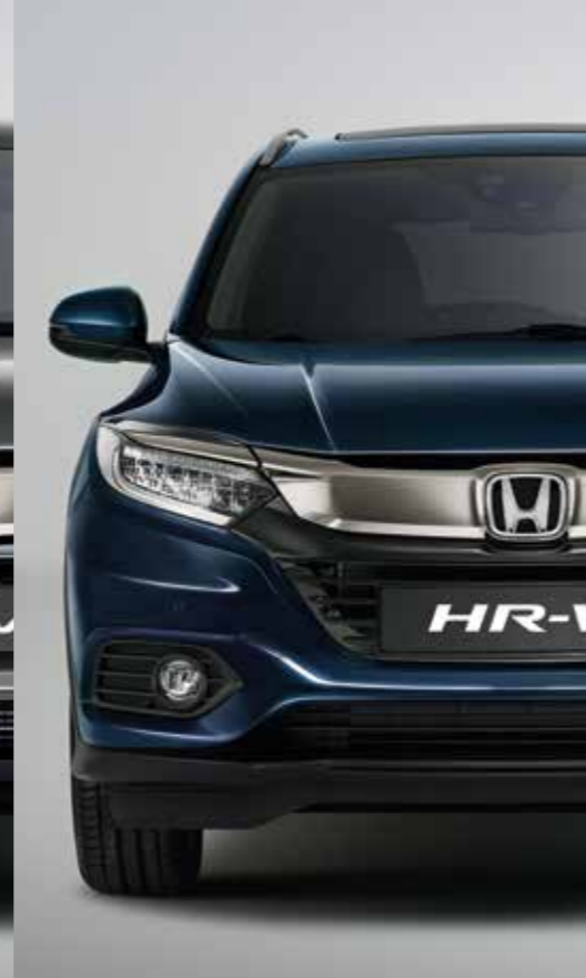
MIDNIGHT BLUE BEAM METALLIC