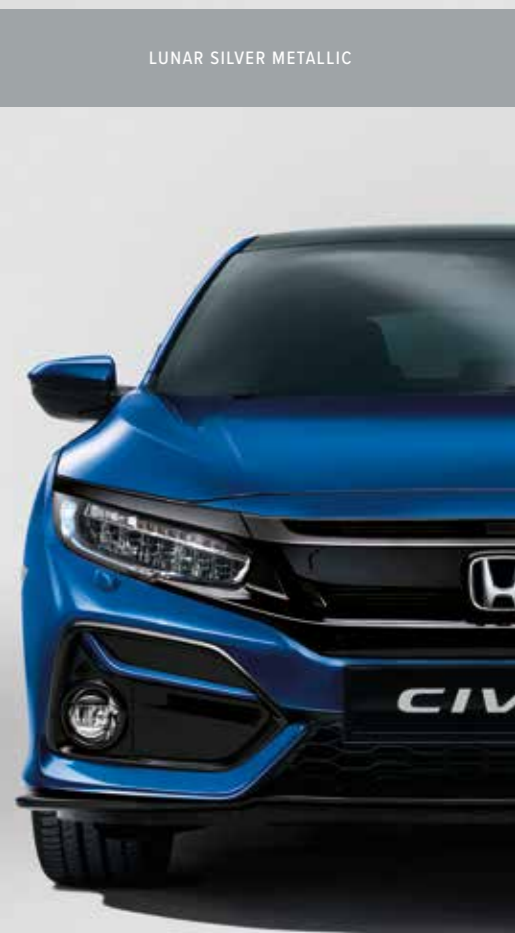
BRILLIANT SPORTY BLUE METALLIC