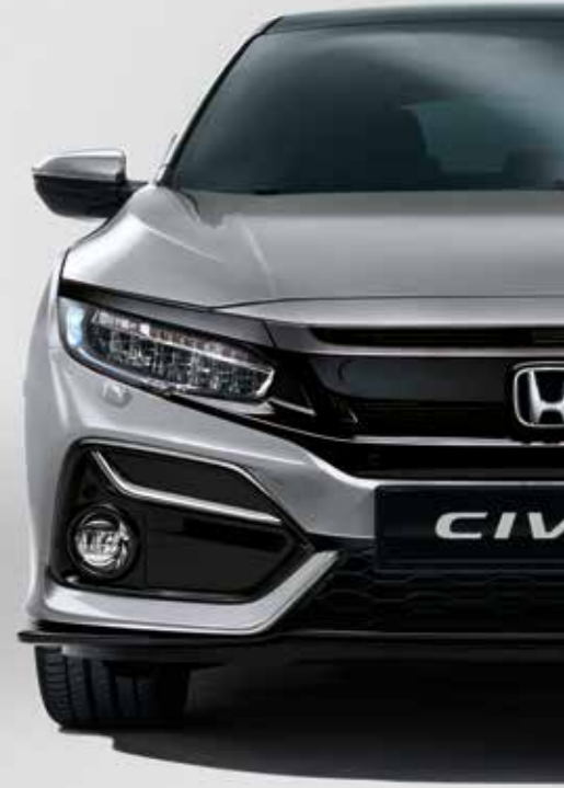
LUNAR SILVER METALLIC