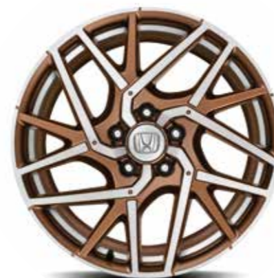
18" CI1805 BRONZE PAKETI VALUVELG