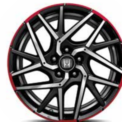
18" CI1806 RED PAKETI VALUVELG