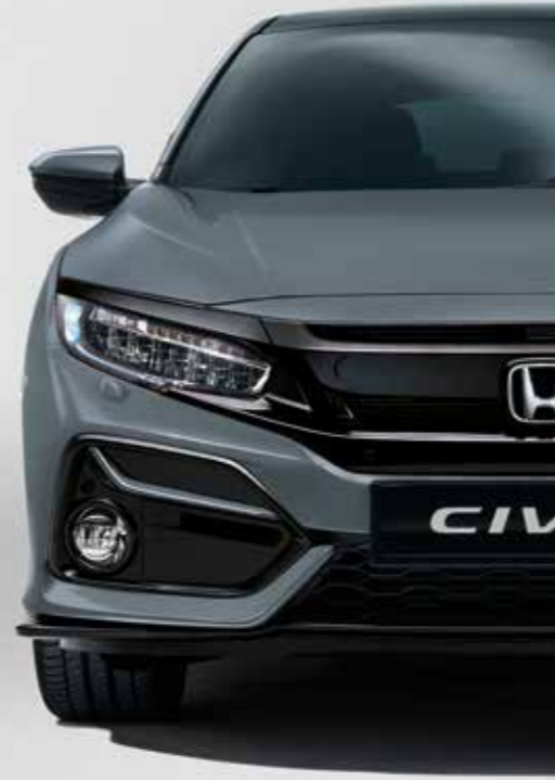
SONIC GREY PEARL