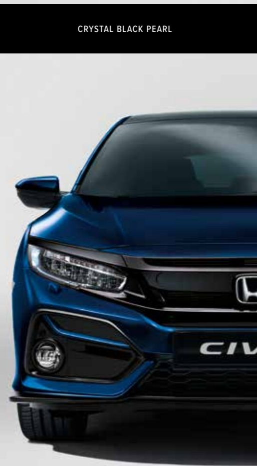
OBSIDIAN BLUE METALLIC