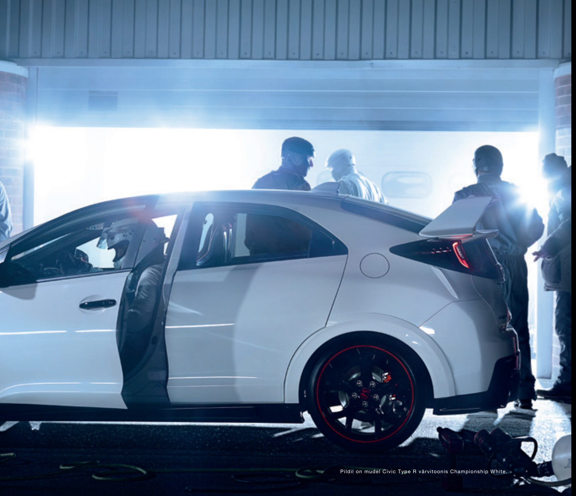
Pildil on mudel Civic Type R värvitoonis Championship White.