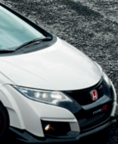
Polished Metal Metallic